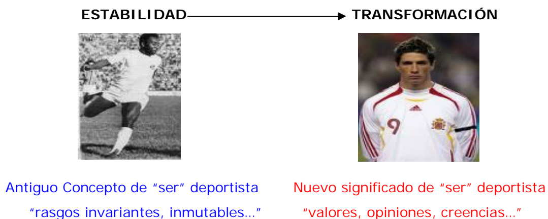
Figura 1. Diferentes significados de "ser deportistas".

Por tanto, todo límite a nuestra transformación remite a obstáculos específicos. Sólo podemos determinar si ese obstáculo puede o no puede ser disuelto si somos, primero, capaces de identificarlos y segundo, realizar acciones para transformarlos. Por tanto, el coaching deportivo descansa en una nueva interpretación sobre lo que significa "ser deportista", interpretación que se ha venido desarrollando desde lo que se ha llamado la "ontología del lenguaje" aplicado al deporte.