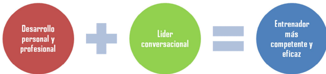
Figura 4. Beneficios del coaching deportivo para el entrenador

capaz de ayudar a los miembros de su equipo, y al propio equipo, en su camino hacia la excelencia deportiva.