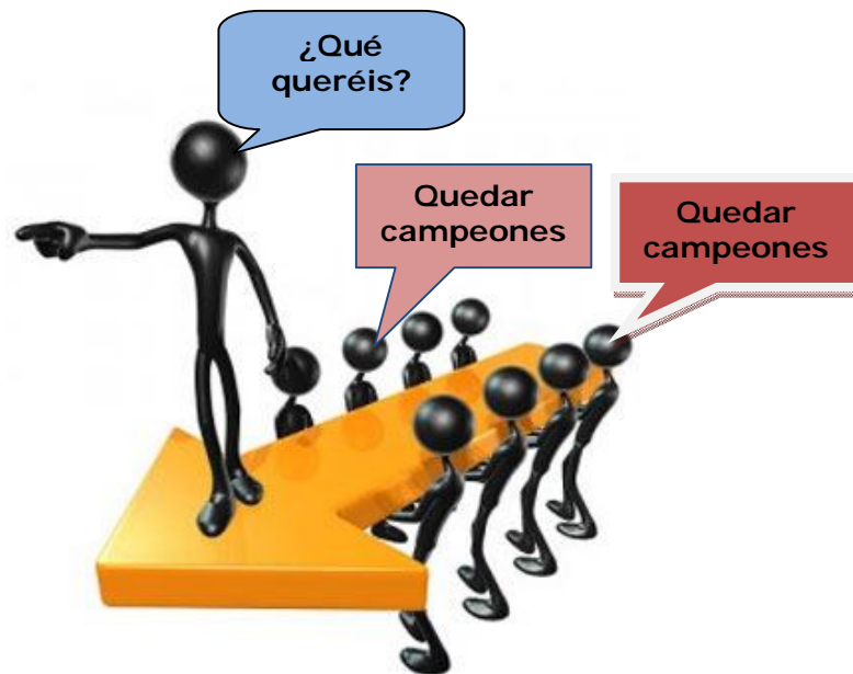
Figura 2. El entrenador conversacional

Por tanto, el Entrenador Conversacional (EC) es aquel que posee competencias de comunicación avanzadas, que acompaña en un proceso de transformación al deportista y/o equipo, posibilitando el aprendizaje, nuevas alternativas y resultados (ver figura 2).