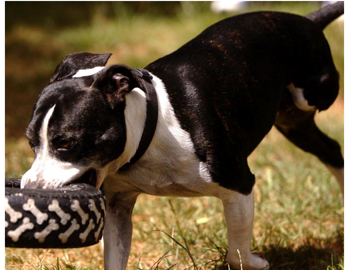
Daño Terrible: este perro, ahora en cuidado de la RSPCA, perdió una pierna a causa del abuso animal.